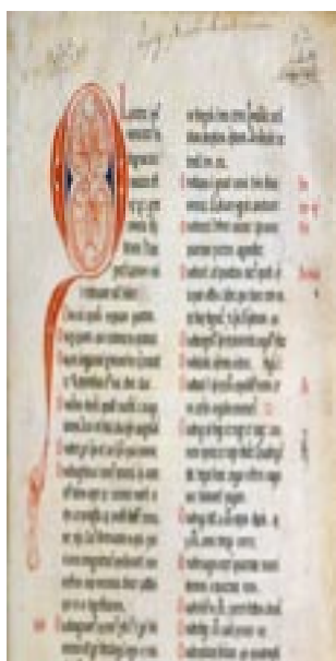
Imagem 4: Gramática Papias , 10 --

Teixeira de Pascoais, in A Águia , citado por Francisco Álvaro Gomes, O Acordo