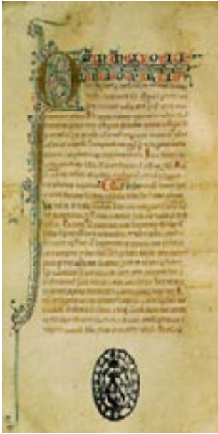
Imagem 1: Gramática De accentibus

Segundo notícias que têm vindo a lume, em janeiro deste ano deu-se início ao processo de entrada em vigor do novo acordo ortográfico, passando, gradualmente, os documentos oficiais a ser escritos segundo as novas regras, às quais, paulatinamente, todos vamos ter de nos adaptar.