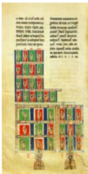
Imagem 3: Gramática Papias , 10 --

Bases da Orthografia Portuguesa, II-b), 2.º.