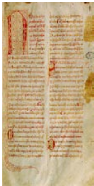
Imagem 14: Portugal, leis, decretos, etc.