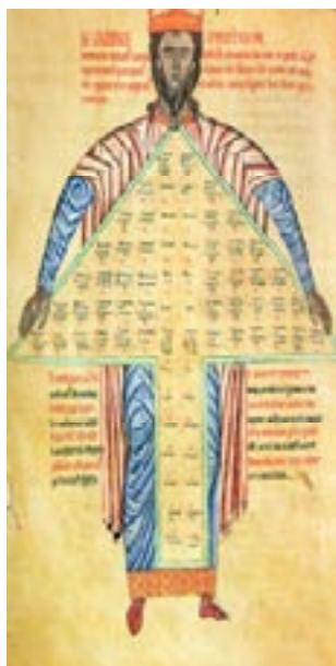
Imagem 9: Etymologiae - Isidoro de Sevilha Santo, ca 560-636

a) nos ditongos tónicos oi e ei , quando em posição paroxítona, ou grave (em Portugal já não se colocava o acento no ditongo ei ...). Assim, jóia passa a escrever-se joia e os brasileiros deixam de escrever idéia e passam a escrever ideia , etc... Isto, saliente, acontece com as palavras graves, desde que a estrutura da palavra não exija a explicitação do acento gráfico, como acontece em palavras terminadas em l , r , z , x , e n , o que leva a que palavras como géiser e Poséidon mantenham o acento gráfico. Nas palavras terminadas em ditongo agudo não há