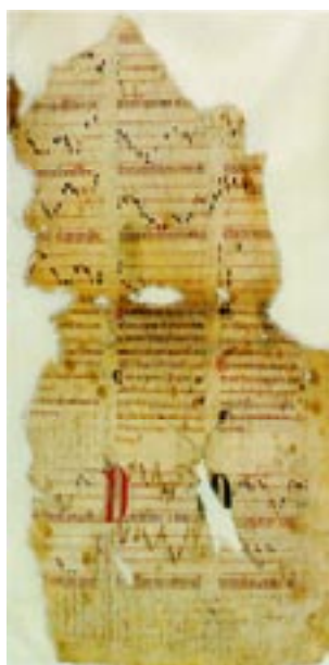
Imagem 8: Dinis, Rei de Portugal, 1261-1325