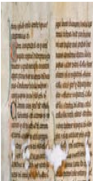
Imagem 12: Vocabularium

Mantém-se também o hífen com os elementos de ligação grã (grã-duquesa), grão (grão-mestre), além (além-mar), aquém (aquém-mar), recém (recém-chegado) e sem (sem-cerimónia). O Vocabulário da Porto Editora inclui aqui quase (quase-delito) e não (não-agressão). No entanto, O Vocabulário da Academia Brasileira de Letras não introduz estes dois elementos (não e quase) no domínio