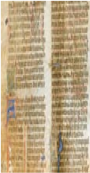
Imagem 11: Vocabularium

f) Mantém-se o acento discriminatório em formas verbais como pode - pôde; demos - dêmos, etc. Mantém-se também para distinguir a preposição por do infinitivo do verbo pôr. Na primeira pessoa do plural do pretérito perfeito dos verbos da primeira conjugação esse acento é facultativo. O vocabulário do ILTEC, dá, na conjugação, conta destas situações.