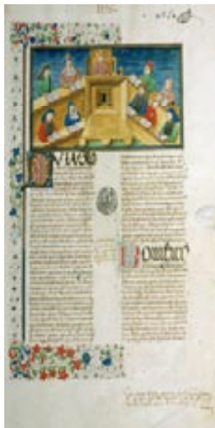
Imagem 5: Sala de Aula

Bernardo Soares (Fernando Pessoa), Livro do Desassossego .