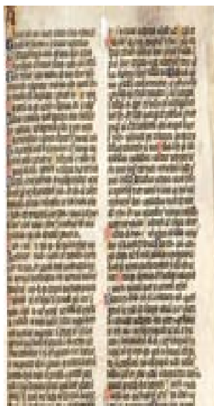
Imagem 13: Vocabularium