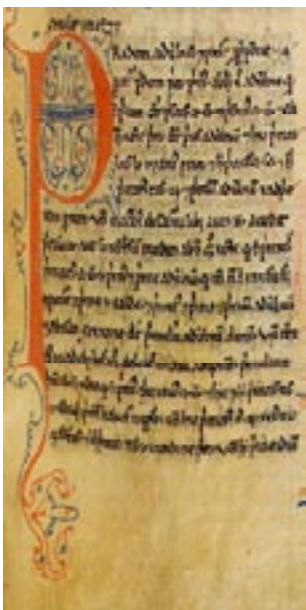
Imagem 2: Gramática Osbernus de Gloucester, fl 1150

Numa tentativa de alterar o caos ortográfico, que se mantinha, Gonçalves Viana e Guilherme Abreu lançam, em outubro de 1885, as Bases da Ortografia Portuguesa , de distribuição gratuita. Essa bases, disponíveis em http://purl.pt/437/6/1-