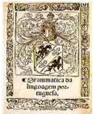
Imagem 16: Rosto da Gramática de Fernão de Oliveira