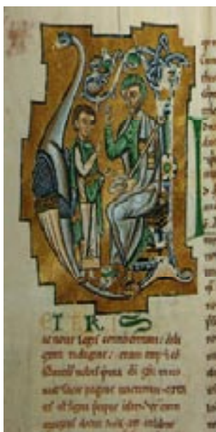
Imagem 6: Mestre e discípulos

É visível o interesse que ambos os países sentem em encontrar uma norma ortográfica comum. Tal já vem a ser demonstrado desde 1907, ano em que a Academia Brasileira de Letras, sob a orientação de nomes ilustres, como Euclides da Cunha, Rui Barbosa e outros, projectava uma reforma idêntica à defendida por Gonçalves Viana. Mas o facto da [sic] reforma de 1911 ter sido feita sem qualquer intervenção do Brasil, motivou que, durante anos, os dois países utilizassem ortografias completamente diferentes (Portugal, com a ortografia moderna e o Brasil ainda com a ortografia pseudo-etimológica).