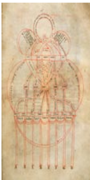
Imagem 10: Etymologiae - Isidoro de Sevilha Santo, ca 560-636