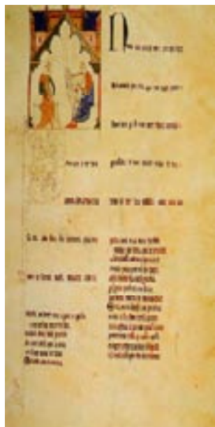
Imagem 7: Cancioneiro da Ajuda

As alterações centram-se na base IV, que prevê a queda das consoantes